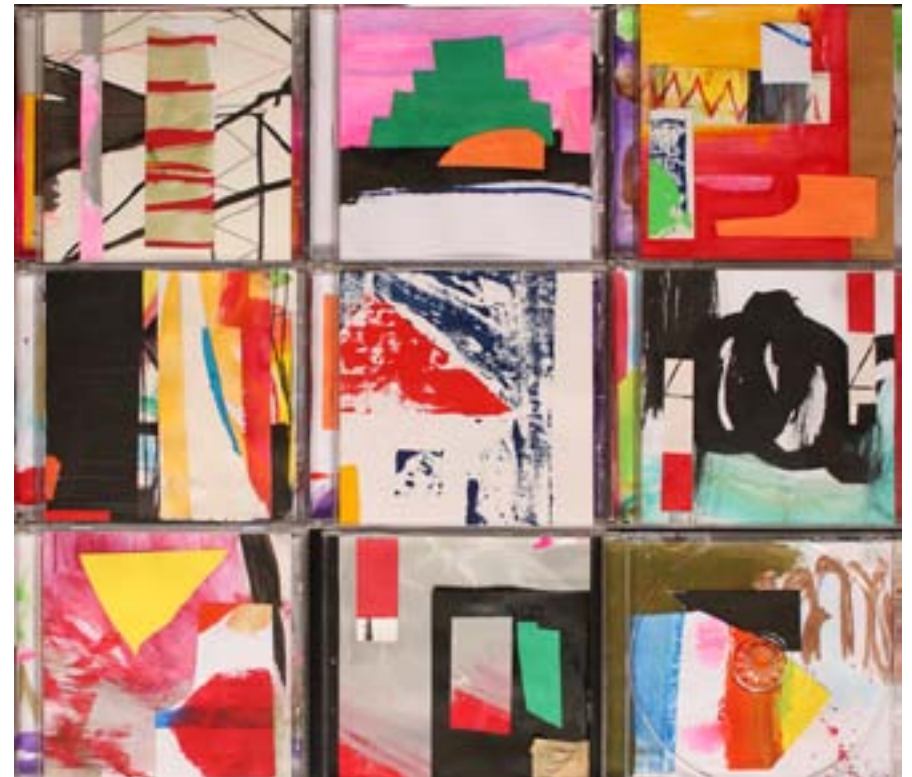
Sozaku Miyazaki CD covers Collage, acrílico y acuerela sobre CD