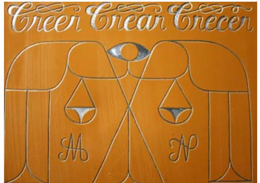
Remed Opus Magnus Intervención sobre capó de coche